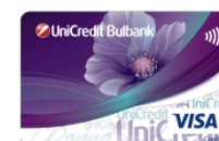
VISA Classic Donna (credit card) ПРИЛОЖЕНИЕ 8.3.4