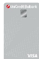
VISA DEBIT ПРИЛОЖЕНИЕ 8.1.1