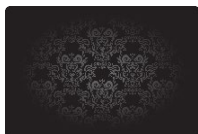
Mastercard World Elite ПРИЛОЖЕНИЕ 8.1.4