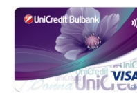
VISA Classic Donna (credit card) ПРИЛОЖЕНИЕ 8.3.4