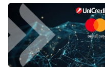
Digital Debit Card ПРИЛОЖЕНИЕ 8.1.9