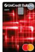
Debit Mastercard ПРИЛОЖЕНИЕ 8.1.2