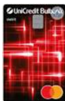
Debit Mastercard ПРИЛОЖЕНИЕ 8.1.2