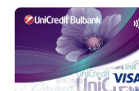
VISA Classic Donna (credit card) ПРИЛОЖЕНИЕ 8.3.4