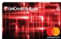
Debit Mastercard ПРИЛОЖЕНИЕ 8.1.5