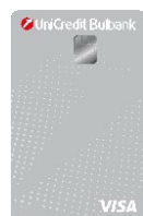
VISA DEBIT ПРИЛОЖЕНИЕ 8.1.1