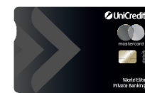
Mastercard World Elite ПРИЛОЖЕНИЕ 8.1.5