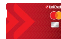
Mastercard Standard ПРИЛОЖЕНИЕ 8.3.6