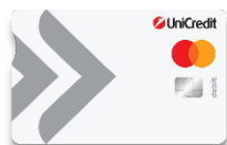
Debit Mastercard ПРИЛОЖЕНИЕ 8.1.1