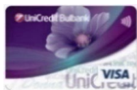
VISA Classic Donna (credit card) ПРИЛОЖЕНИЕ 8.3.1