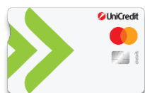
Debit Mastercard Kids ПРИЛОЖЕНИЕ 8.1.6