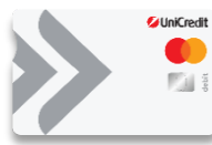
Debit Mastercard ПРИЛОЖЕНИЕ 8.1.2